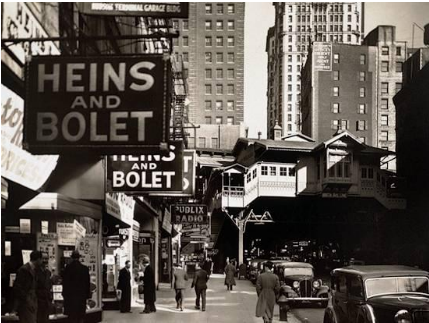
Berenice Abbott : New York