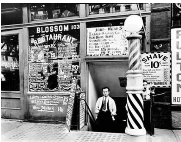
Berenice Abbott : New York

C'est pendant cette période qu'elle découvre le travail photographique d'Eugène Atget pour lequel elle se passionne.