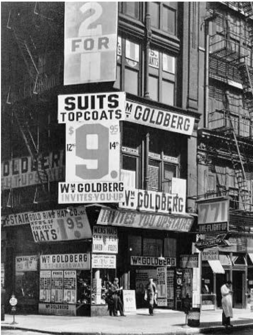
Berenice Abbott : New York