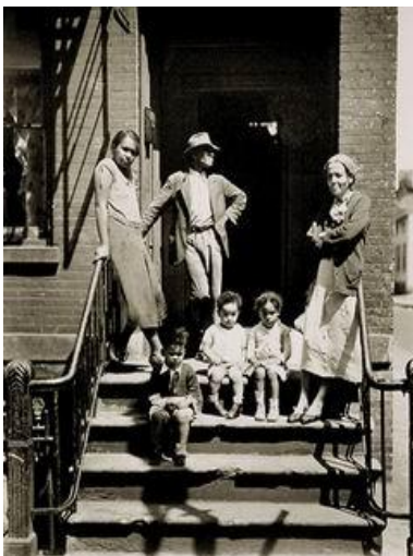
Berenice Abbott : New York

Berenice Abbott ouvre un studio de portraits et obtient assez rapidement des publications dans des magazines américains comme Vanity Fair, Fortune ou encore Saturday Evening Post.